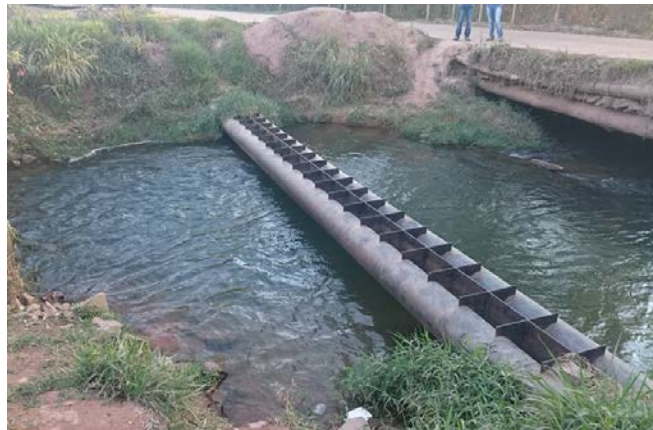
Figura 8: Margem degradada entre reservatório e ETA.

Na própria margem há sulcos e caminhos preferenciais para enxurradas direcionadas pela estrada.