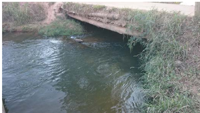
Figura 9: Detalhe da ponte sustentada por madeira.

O impacto antrópico também é muito alto, já que toda área está alterada. A ponte está em condições duvidosas, por ser precária (figura 9) e ser mais um indício de comprometimento da qualidade da água do rio.