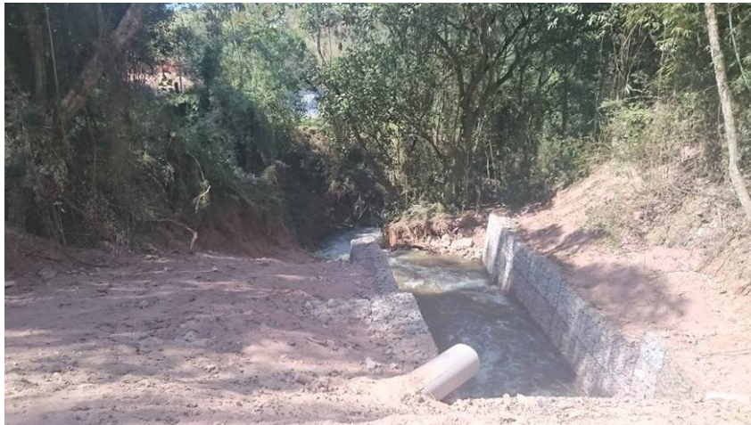
Figura 3: Margens degradadas do canal aberto da transposição do Rio Atibaia

Este ponto é próximo a uma estrada e uma ponte. Percebemos de imediato a degradação das margens, que se encontram com solo exposto (figura 3). O que mantém a estabilidade e diminui a deposição de sedimentos é a presença de gabiões em toda extensão onde ocorre solo exposto nesse ponto de observação do canal aberto. Um tubo de drenagem da estrada é um indicador da ocorrência de poluição da água desse canal e da possibilidade de contaminação (por exemplo, de um vazamento de óleo de carro que se dilui na água da chuva).