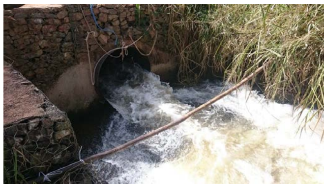
Figura 2: Início do canal aberto da transposição do rio Atibaia

Esse ponto de observação é de difícil acesso, devendo-se percorrer a pé um trecho de aproximadamente 1 km desde um ponto da estrada até o local de saída da adutora da transposição até o canal aberto, visto na figura 2, a seguir.