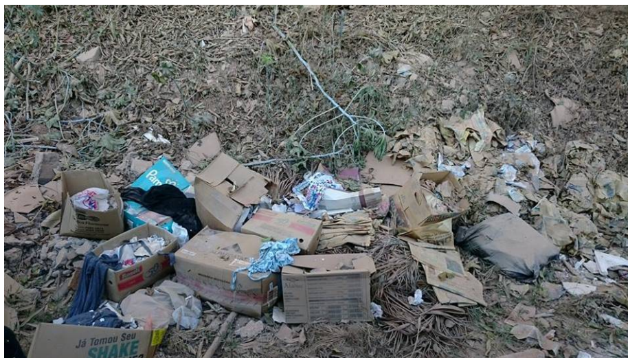
Figura 7: Resíduos sólidos próximos a margem do rio.

A proximidade com a estrada indica possibilidade de impactos antrópicos transitórios, pela passagem de carros na área. Levando em conta a maior densidade e cobertura vegetal, esse parece ser exatamente o principal motivo de ser o ponto onde houve maior ocorrência de deposição indevida de resíduos sólidos (figura 7), todos em grande quantidade, provavelmente de pessoas que abandonaram ali, propositalmente, caixas com resíduos.