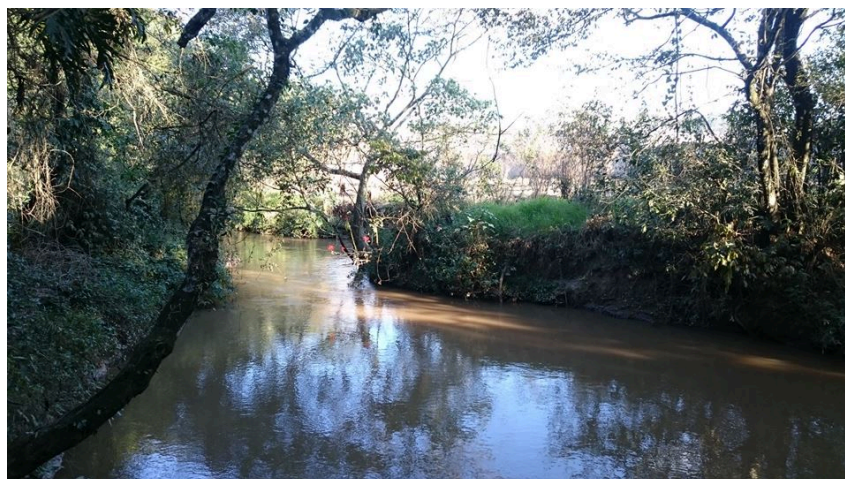
Figura 6: Calha do rio com alta densidade vegetativa

Apesar da alta densidade, não há muita diversidade, já que há trechos de predomínio de brachiaras, cipós e ervas daninhas (figura 6).