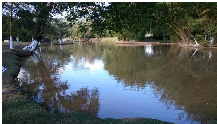
Figura 5: Calha alargada com ocorrência de solapamentos

Há uma pequena fauna de aves, como patos, gansos e marretos, exatamente por isso percebe-se a saturação da água do rio nas margens por ração de patos e pedaços de comida, que são utilizados para alimentação desses animais.