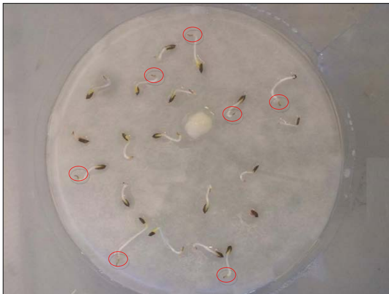
Figura 2- Necrose nas raízes em presença do lixiviado bruto (1,5%)

consequentemente a falta de fixação da planta devido as condições das raízes. Cabe ressaltar que as raízes expostas ao lixiviado tratado nas concentrações de 3%, 6% e 12% também apresentaram sinais de necrose.