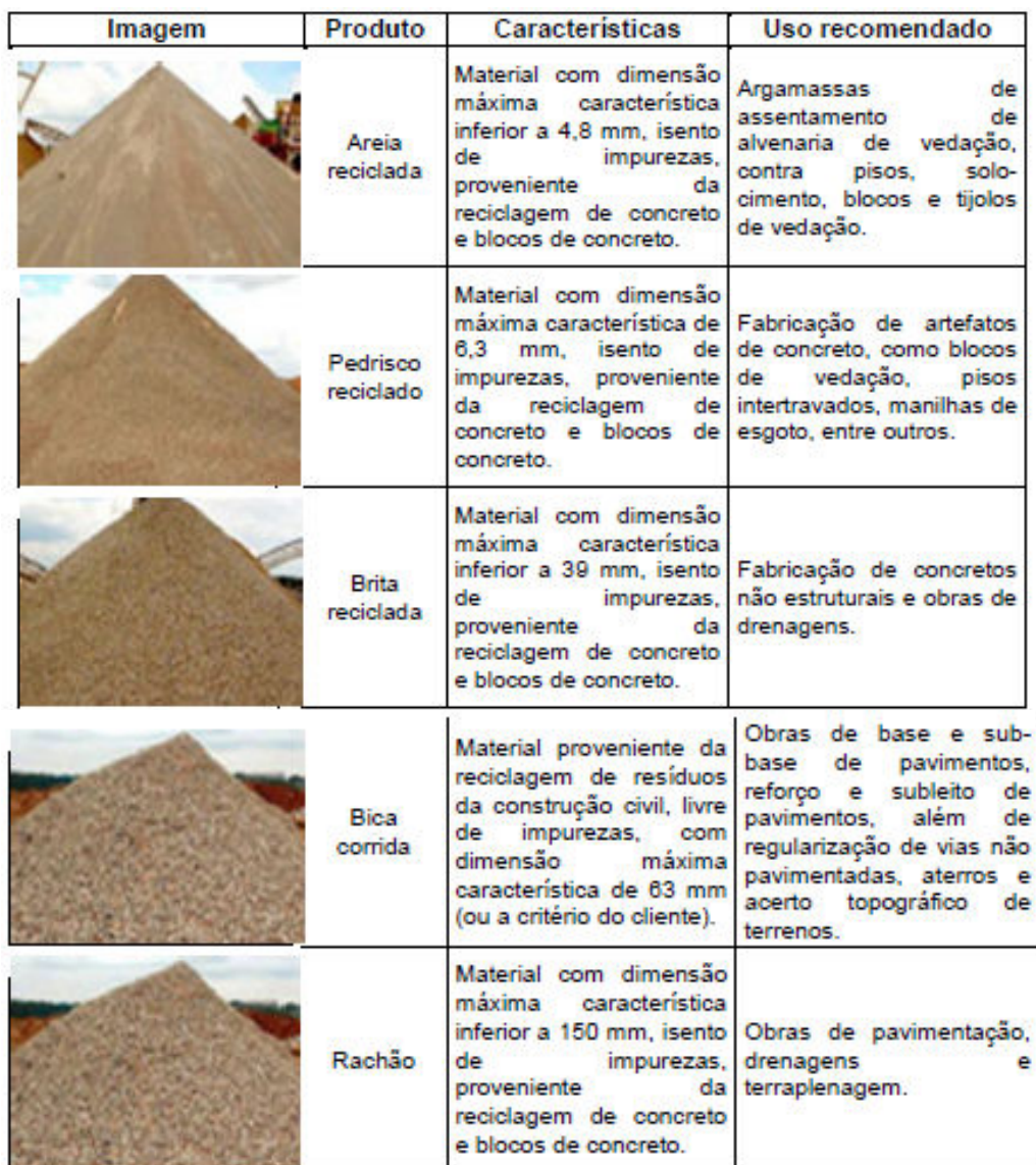
Figura 3: Uso recomendado para o agregado reciclado

Na FIG. 3 é possível verificar o uso recomendado para o agregado reciclado: