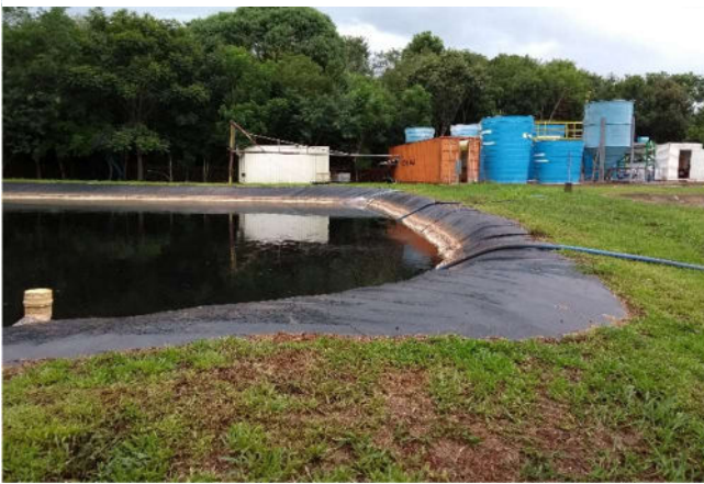
Figura 1 Tanque de equalização. Fonte: Autor. 2018