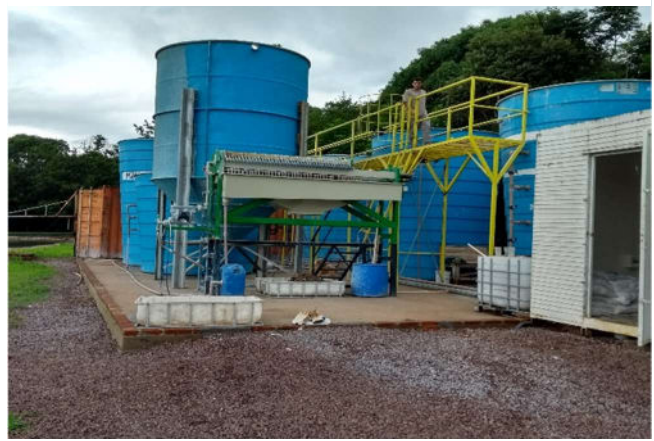
Figura 2 Planta de tratamento de efluentes instalada.