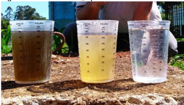
Figura 6 Chorume bruto, após a saída do decantador e efluente tratado.

Dentre as principais limitações que os operadores de uma estação de tratamento de lixiviado de aterro sanitário encontram estão as elevadas concentrações de nitrogênio amoniacal presentes no local. A eficiência global do sistema foi de 77,9% de remoção de N-NH_4^+ e 84% de NTK, com valores médios de 42 mg.L -1 ( N-NH_4^+ ) e 51 mg.L -1 (NTK) ao final do tratamento. Em todas as análises, os resultados apresentaram valores acima do limite máximo estabelecido nas legislações, de 20mg/L. A figura 6 demonstra os aspectos visuais do chorume pré e pós-tratamento: