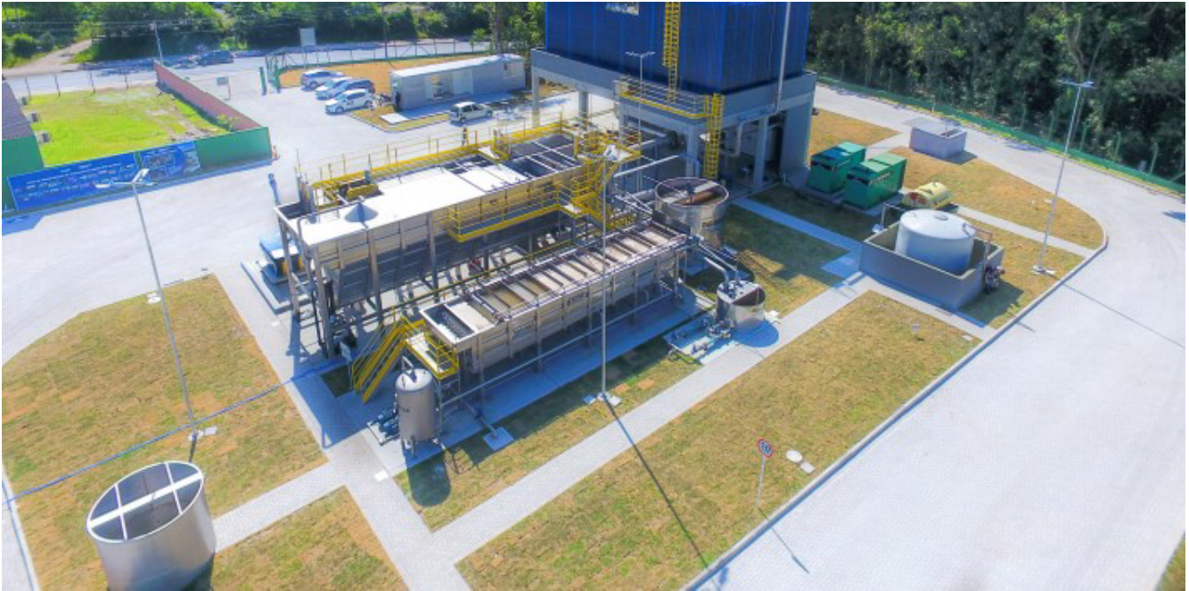
Estação de tratamento Iguá Saneamento.

O fundo de pensão canadense CPP deu largada ao primeiro de uma série de investimentos que pretende fazer no setor de saneamento no Brasil após a sanção do novo marco legal do setor, há menos de um ano. O CPP fechou acordo para aportar R$ 1,18 bilhão em troca de uma fatia de 45% na Iguá Saneamento , conforme valores antecipados pela Coluna do Broadcast em janeiro.