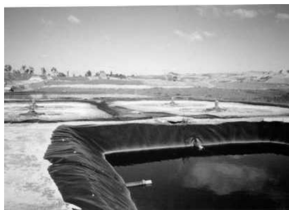
Foto 1 - Lagoas Anaeróbica, Aeróbica e de Decantação.

Neste aterro existem 5 poços de monitoramento de lençóis freáticos (3 montantes e 2 jusantes). Eles são monitorados a cada três meses (alguns parâmetros: turbidez, temperatura, pH, alcalinidade, OD, DBO, DQO, sólidos, coliformes totais, metais pesados, etc).