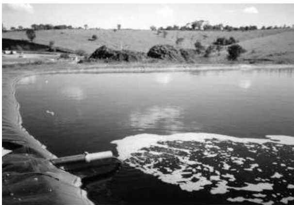
Foto 2 - Chorume chegando do aterro para o tratamento