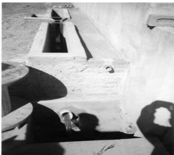
Foto 3 - Chorume já tratado