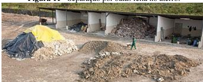
Figura 11 - Separação por baias feita no aterro.