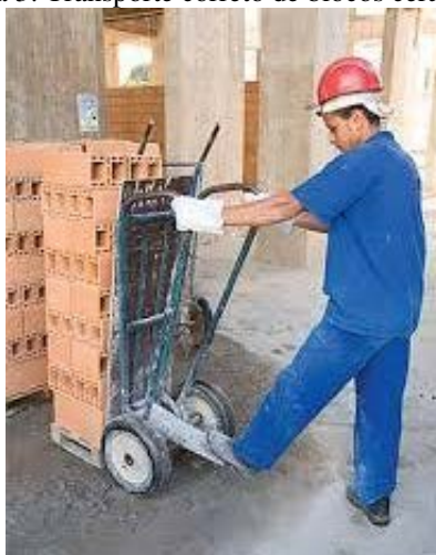
Figura 3: Transporte correto de blocos cerâmicos.