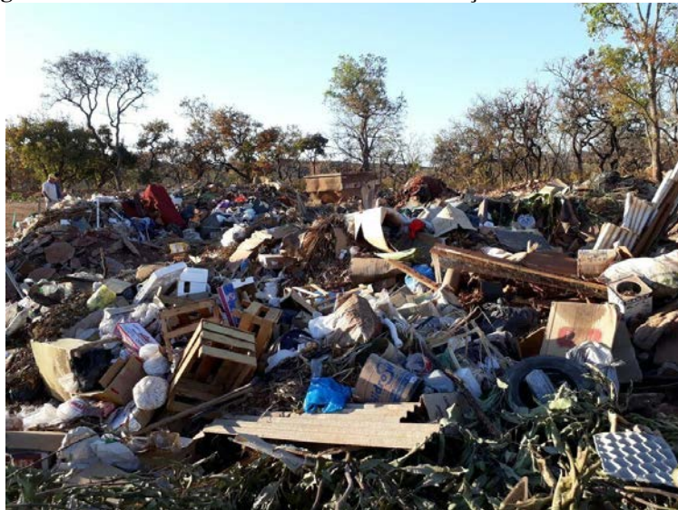
Figura 8 - Foto atual do aterro de RCD de construção civil.

deste RCD. De acordo com as Figuras 8 e 9, a coleta e a armazenagem atual não cumprem normas ou facilita o processo de separação dos RCDs de construção civil.