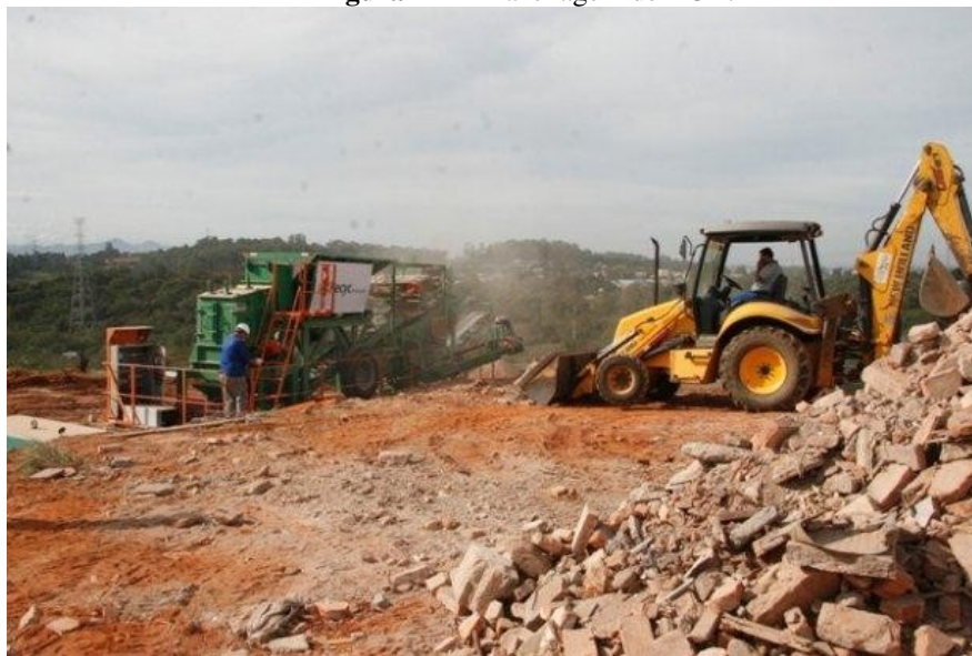
Figura 2 - Armazenagem de RCD.

e o melhor aproveitamento dos resíduos da construção civil. A reciclagem não só ajuda a diminuir os espaços utilizados para aterros/lixões, como também auxilia na diminuição da exploração dos recursos naturais.