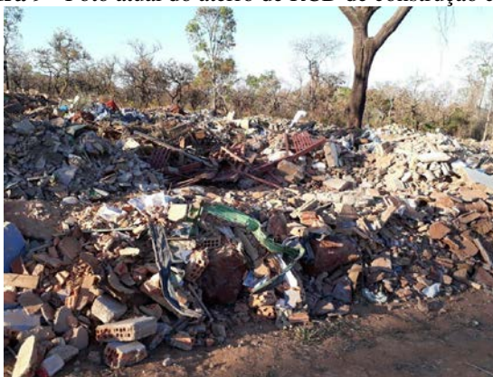
Figura 9 - Foto atual do aterro de RCD de construção civil.