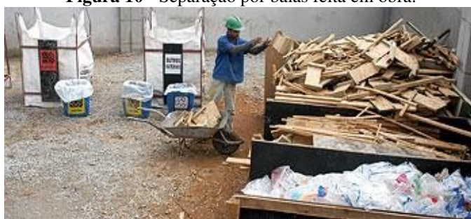
Figura 10 - Separação por baias feita em obra.

Pode-se contratar empresas privadas para essa coleta por meio de processos licitatórios, além da possibilidade de implantação de treinamento dos pedreiros e serventes de forma que os mesmos construam baias de separação (Figura 10 e 11). A coleta dos RCDs das obras ser realizada por meio de transporte separado, o que facilitaria o manejo dos materiais para reciclagem e reaproveitamento.