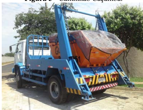
Figura 5 - Caminhão Caçamba.