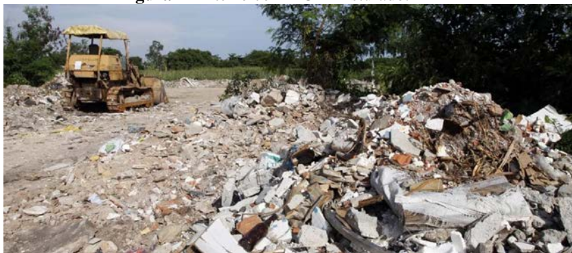
Figura 1 - Aterro com RCD misturado.

Não havendo um lugar adequado para armazenar e descartar esses resíduos, os mesmos são jogados junto a lixões, bota-fora clandestinos, margens de rios e aterros municipais, dificultando assim o trabalho de reciclagem deles e de outros materiais ali armazenados (Figura 1).