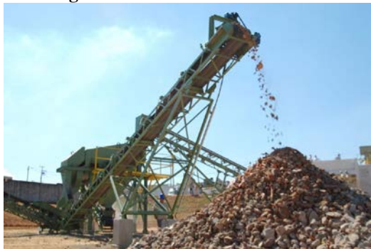
Figura 6 - Beneficiamento de RCD.

Para uma melhor estocagem e organização, a administração pública deve fornecer ou contratar empresa privada que tenha o maquinário necessário para o beneficiamento destes materiais (trituração) para melhor estocar o material e facilitar o uso em obras (Figura 6).