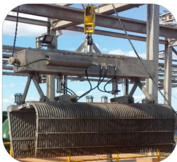
BRAÇOS ARTICULADOS ( LIMPA GRADES )