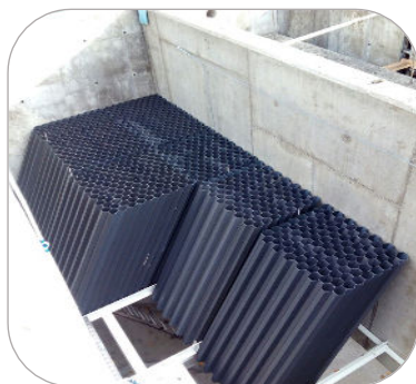
MÓDULOS DE DECANTAÇÃO